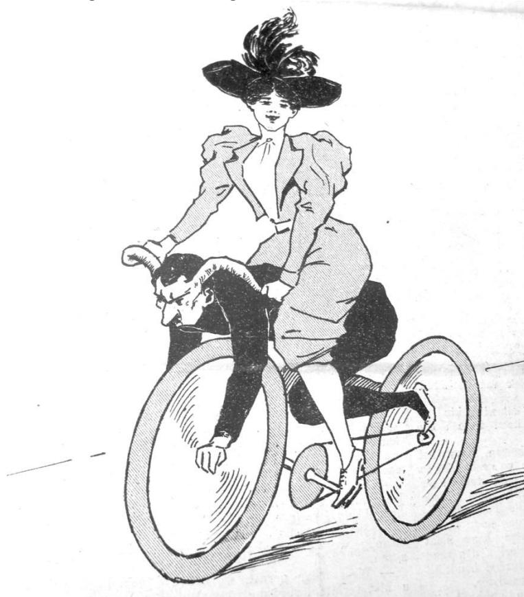
Afb. 1: 'Bicycle merk "Cocu"'. In Pst Pst 1:31, 1896, 1.

Prostituees, zangeressen, toneelspeelsters en vrouwen die als serveerster in uitgaansgelegenheden werkten hadden een bijzondere status. Zij waren niet in de eerste plaats dochters of echtgenotes, maar genoten grotere zelfstandigheid en onafhankelijkheid in de publieke ruimte. 29 Deze status bracht ook losbandige en onzedelijke associaties met zich mee. Dit type vrouw stond tegenover de ‘goede’, zedelijke vrouw, die zich bijna uitsluitend in huiselijke kringen ophield. 30 De vrouwen die in Pst Pst werden afgebeeld, behoren allemaal tot de groepen die in de publieke ruimte opereerden. In het blad stonden talloze prenten van naakte vrouwen die voor een kunstenaar poseerden en daarnaast kwamen afbeeldingen van schaarsgeklede vrouwen op een fiets frequent voor.